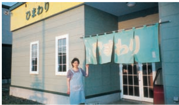
のれんが優しく風に揺れる

客が次々とやってきた。親子3人連れ2組に続いて作業服姿の若い男たちが2人、3人と連れ立って来ると、お母さんは「はい、醤油(しょうゆ)ラーメンとライス。本多さんが威勢よく注文の品を告げると、お母さんは「はい、醤油と好みは、味噌、味噌、塩と好みのラーメンを注文、チャーハンやギョウザをとる人もいる。出前の電話が鳴る。厨房にはめんをゆでる湯気が立ち