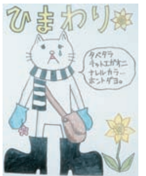
未来さんのイラスト

「現実には引き戻されよう」お母さんの頭に、札幌市内で評判のラーメン店を開業している夫の親友のことが浮かんだ。その方を頼って、ラーメンづくりの修業をしようという決心をした。お母さんの熱意が伝わり、相手は快く引き受けてくれた。