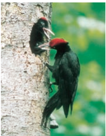
クマゲラの親子(北海道朝日町)

高校に入学してすぐ「学校を辞めたい」と思いました。両親に男子がいたら、同じ中学の人は1人もない高校に来たのに「この人たにもいじめられる。私がいじめられていたことを知っている」と、勝手に思い込んでいたからです。