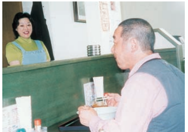
うまい！この味は極上だ

昭和62年6月24日の深夜のことだった。仕事を終えた夫が、バイクで帰宅途中、飲酒運転の男にひき逃げされた。数時間後に犯人は逮捕されたが、どうしようもなかった。それから4、5日の間にお母さんは