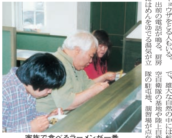
家族で食べるラーメンが一番

昭和62年6月24日の深夜のことだった。仕事を終えた夫が、バイクで帰宅途中、飲酒運転の男にひき逃げされた。数時間後に犯人は逮捕されたが、どうしようもなかった。それから4、5日の間にお母さんは