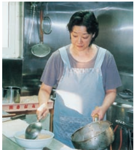
手つき鮮やか、ラーメン1丁上がり

店は、のれんも建物もヒマワリをイメージした緑と黄色系に統一されていた。店内は、テーブル席が5つとカウンター席が7つ、ほどよい照明に照らされていた。その奥には、めん上げ機、食器洗い機、ガス台、冷蔵庫などが見える。内装はグレーを基調にすっきり。約50平方メートルの店