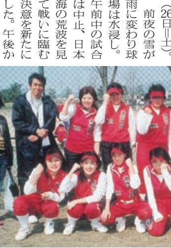
勝った！、喜びの帝塚山チーム