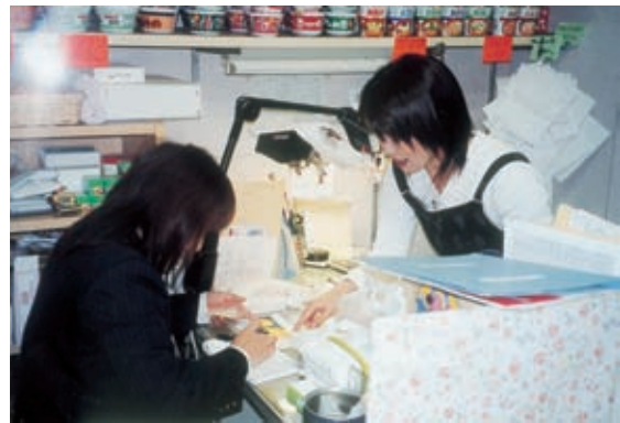
労金の集金係にしっかり説明

はようございます」。あい さつのと、一言二言話し てはドリンク剤やティッシ ュ、牛乳フィルムなどを 買って行く。公費の伝票で の買い上げもある。自販機 の横につるした「お弁当注 文書」「パンの予約帳」に記 入する人が多い。代金先払 いのお弁当やパンは、朝注 文するとお昼時間に合わせ て作られるので格別におい しいと好評だ。 10時前、パソコンを立ち 上げ、前日から溜まってい る仕入れ伝票の処理をしよ うとしたが、この日は 職員の手配が重な り、客が立て込んでいすに 座る間もない。 取り扱うのは物品の販売 だけではない。労金の窓口 係や切手の受け渡しの大事 な仕事もある。切手は市内 22の小・中学校や公民館な どで使う分をまとめて買い 置いて渡すのだ。掛け売り の一括精算、お札の両替も する。お客さんとは時間が 許す限り対話する。 お母さんの仕事ぶりには、 出店している組合幹部らも 全幅の信頼を寄せている。 ひっきりなしに電話が鳴 る。白いセーターに黒エプ ソン姿の小柄なお母さん は、身を躍らせて受話器を 元気のいい若者がお茶の 納品に来た。「おー」お母 さんの顔が思わずほころぶ。 分属毛した。