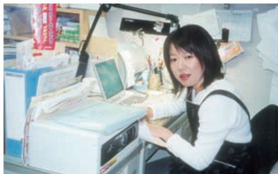
伝票整理や商品管理はパソコンで