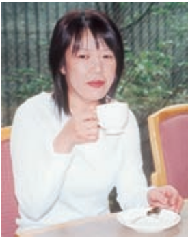
休日、くつろぐお母さん

「お父さんがいたら、そ ういうことしたら殴られて よ。はっとして、すぐや めた。甘いのが好きだっ た父親の体型やしぐさ、「あ あいうとき、こう言ったん だよ」。事に触れてお母さ んが話す父親が、子どもの 胸の内に生きています。 中越地震では川口町の叔 父の家が全壊して一時孤立 状態になった。お母さんの 弟の家もライフラインが止 まって家へ1週間ほど家族 が避難してきた。そんな 折、子どもたちは被災した 人々みんなを思いやってい た。父親譲りの優しい心根 がうれしかった。 お母さんが今一番気掛 りなことは、子どもの将来 のこと。若者が働かないと か、仕事が続かないとか問 題になっているが、普通 に働いて自分で生活できる 自立した子どもに育てほし いと願っている。 「自分のことは、子ども たちが大人になってから。 その時は趣味のエレクト ーンの再開でも思うが、当 面の楽しみは友達と時々買 うジャンボ宝くじ。なかな か当たらないけど夢が楽し い」と明るく笑った。