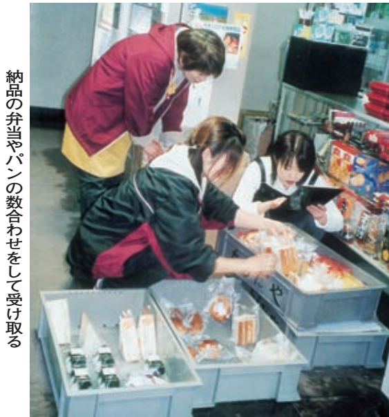
納品の弁当やパンの数合わせをして受け取る