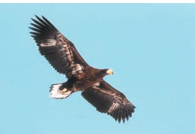
上昇気流をとらえ、大空を旋回するオオワシ (旭川市江丹別で)

収入総額は18億2363 万円。財産運用収入2億5 938万円、寄付金収入2 億5000万円、奨学貸与 金返還収入1億7860万 円を見込んでいる。 おことわり 「あしなが おさんQ&A」は休みま す。「あしながおさんのお きりめさし」は2面に掲載しま した。