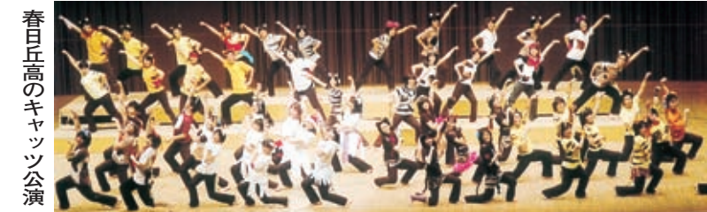
春日丘高のキッツ公演

午後1時、昼食休憩。1時半再開。06総体で合戦が残り、その父に今年春の娘のアメリカ公演はうれしかったようだ。 親善演奏会が成功し、満員の聴衆のスタンディングオーベーションを受けた感動を、楽しそうに聞いてく