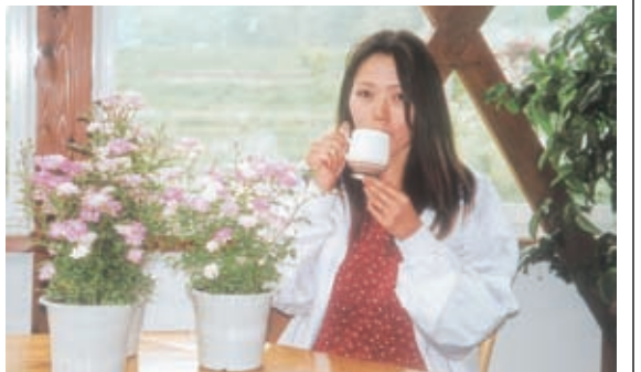
バラの花に囲まれコーヒー・ブレイク

住む外人さん愛情をこめてはかなりの一生懸命やで、花の好き。その分いな人も結構いる。お客さんが次々に来て、お客さんと花の話や世間話は午後1時、最高に楽しい。この気持ちで会社勤めでは味わったことがない。