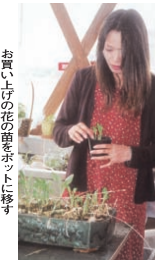
お買い上げの花の苗をポットに移す

平成15年4月、今の店から車で数分離れた場所に「彩花苑」をオープン。なじめの客もできた昨年8月、店を自宅わきに移すのを機に新築した。高校と中学で部活に励む子どもたちの送り迎えを力パーして店番に来てくれる母親の大変さ考えて思い切った。