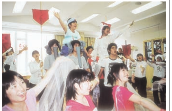
ミュージカル「アラジン」の稽古

合唱指揮をするなど幅広い活動をしている秀でた音楽家。部活の指導では、「生徒たちに少しでも本物の総合芸術を体験させてあげたい」と、本格的なミュージカルを公演したり、シアターのカーフイルド高