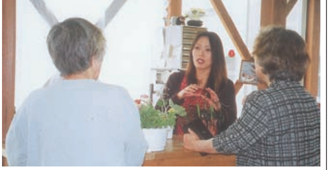
花の育て方を丁寧にアドバイス