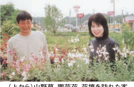
(上から)山野草、園芸花、花壇を訪れた客

住む外人さん愛情をこめてはかなりの一生懸命やで、花の好き。その分いな人も結構いる。お客さんが次々に来て、お客さんと花の話や世間話は午後1時、最高に楽しい。この気持ちで会社勤めでは味わったことがない。