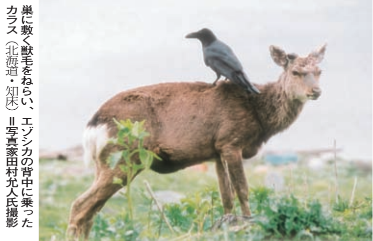
単に敷く獣毛をねらい、エゾシカの背中に乗った カラス(北海道・知床)