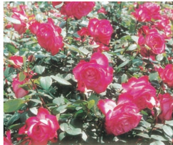
今年初めて、卒業式を迎えました。制服がない学校なので先輩たちは、思い思いの服装で壇上上がっていました。6年生全員で30人程度しかいなかったのだから、うわべだけの人間関係。社会がこんなだとストレスもたまらなう。

僕は今、進路で迷っています。夢はサッカー選手になるのですが、現時点でそれは無理だと判断せざるを得ません。それは、サッカー部員が不足し試合に出られないので、成績や結果を何も残すことができないからです。