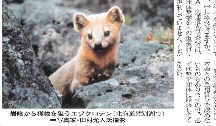
岩陰から獲物を狙うエゾクロテン(北海道然別湖で)

奨学生 Q&A 申請書は、高校生時に申し込み済みと大学進学後に申し込み済みとがあります。 Q 交通遺児育英会以外