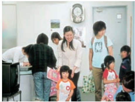
▲ さあ英会話の勉強へ ▼ 教室には元気な笑い声が響く

前に、あるフランチャイズの一つとして、ビルの1室を借りて英会話スクールを開校。その後さらに伊勢市に伊勢校、市内に松阪北校