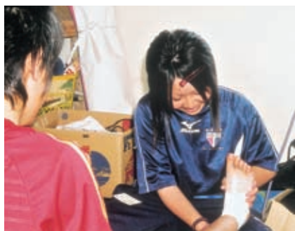
マネージャーからトレーナーに早変わり。テーピングの巻き方も手馴れたものだ