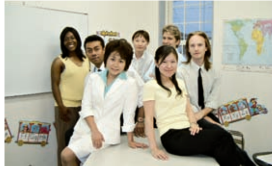
外国人講師たちと一緒に