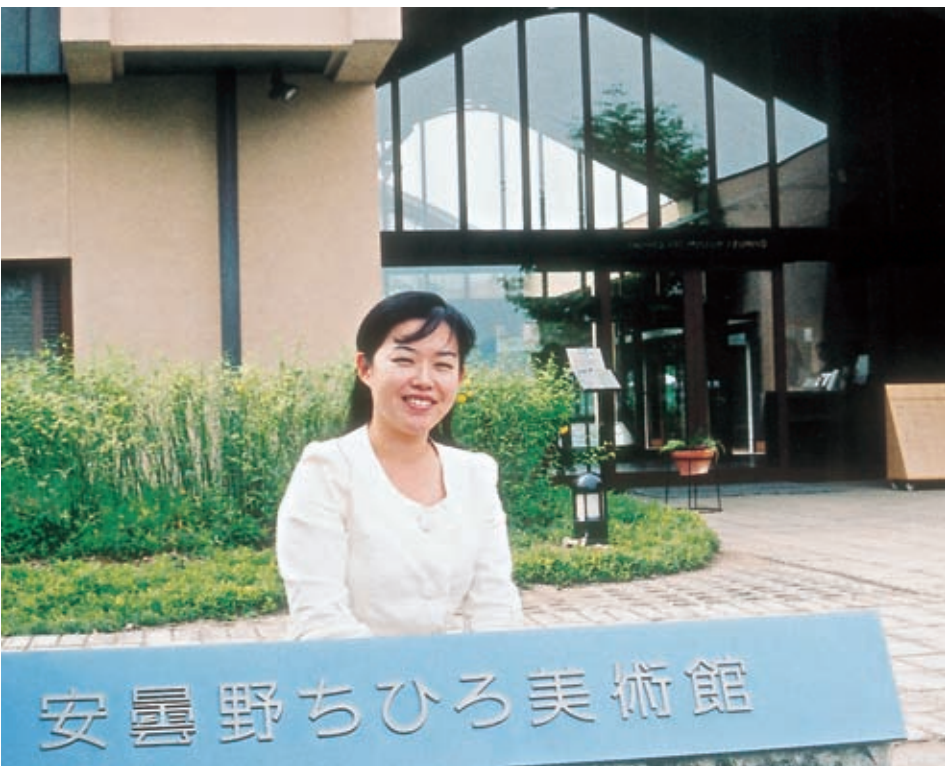
安曇野ちひろ美術館

に、展示パンフレットの原稿作成、旅行会社に出向いて団体ツアー誘致と、やらなければならぬことは大変多い。彼女が絵に興味を持ったのは子どものときからだった。真、絵本、雑誌、遺品、復た。二人っ子のせいもあって「二人っ子のせいもあって