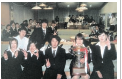
優勝した「魁・保育園ひまわり組」黄チーム

心塾恒例のスポーツフェスティバルが、6月10日、日野4中で行われた。燃えるような脂肪！KJ戦隊スポレンジャーのテーマの下、70人が赤、青、黄、緑、ピンク、黒の6チームに分かれ、バレーボールなど6種目でポイントを競った。各チームとも凝ったオリジナルTシャツを着て、バレーでは練習の成果を、リレーではチームプレーを發揮した。接戦の中、「魁・保育園ひまわり組」の黄チームが優勝。夜のお疲れさま会では、3年の実行委員が用意したカレーに舌鼓。仲間を力合わせて、一つのことをやり遂げた後のカレーの味は格別だった。