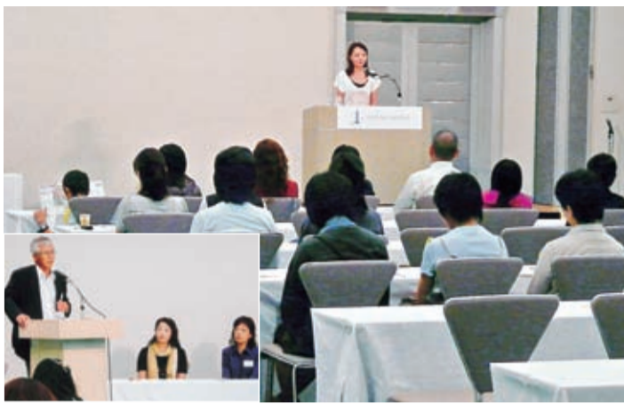
好評だった講演会。左下は講演した2人のお母さん(21年度の「つどい」から)

「つどい」は、奨学生同士、保護者同士、さらにまた奨学生の家庭と本会の親睦を図ることを目的として、