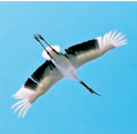
大空へ飛び立つタンチョウ(北海道・鶴居村)

Q いま求職中で返還が 厳しいのですが……。返還 猶予は、どんな場合に受け られるのですか。 A ①学校に在学してい るとき、②病気やけがで働 けないとき、③失業等で収 入がなくなり生活に困ってい るときです。 Q どんな手続が必要 ですか。 A 事務局から「返還 猶予願」を送付しますので、 これに必要な事項を記入して 提出月の翌月に「猶予決定 通知」を送付します(返還 猶予願は本会のホームペー ジからもダウンロードでき ます)。 Q 願ひ出るとき、何 か留意事項はありますか。 A 学校在学中のとき は在学証明書、病気やけが のときは医師の診断書の添 付が必要ですが、求職中の 場合等生活が苦しいときは 出ることがあります。 特に添付書類はありません。 その代わり願書の願ひ出の 理由欄に猶予を申し出る理 由を具体的に記述してくだ さい。なお、猶予期間は学 校在学者は在学期間中であ り、その他の場合は1年以上 内です。ただし、猶予理由 が継続している場合は重ね 付が必要ですが、求職中の 場合等生活が苦しいときは 出ることがあります。