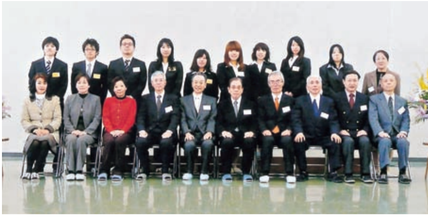
保護者、職員と一緒に記念撮影