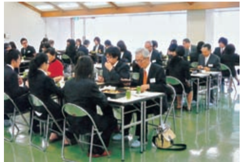
あれこれと話も弾んだ昼食会

5人の計8人が出席。保護者や職員、後輩らに祝福され就職、進学とそれぞれの道へ巣立って行った。