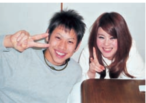
仲よし姉弟のツーショット

「178センチありスマートでスポーツ万能。明るく、人懐こい性格だったので友達も多かった。仕事にも一生懸命な人でした」