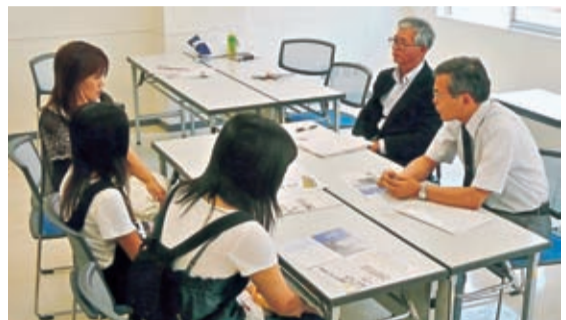
進学や奨学金などを熱心に問いかける(21年度の会場で)

完を目的として始めたのが相談会である。参加者は進学の問題、奨学金の貸付や返還、学校・家庭の悩み、海外語学研修、学生寮の様子などについて気軽に相談に訪れている。