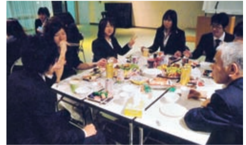
楽しげに談笑する新成人たち