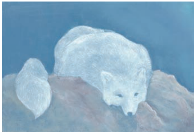
「white fox」 油彩・カンバス

「3年になったら、文系特に進むつもりです。外国語学部英語学科に進みたいんです。それに、イギリスでのルームメイトだったスベインの子と時々メールをやりとりしているんです。その子が夏に日本に来ると、目を輝かせて話してくれました」