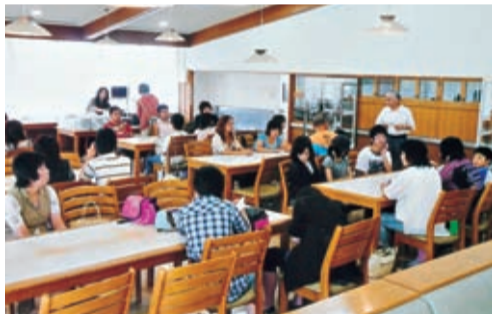
閉会式後、希望者は心塾東京学生寮を見学(21年度の「つどい」から)

「お母さんの講演で、本当は言いたかったかもしれないところまで勇気を持って教えてくださり感謝します」などの保護者の感想が寄せられている。