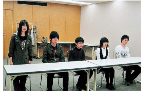
英語による自己紹介ではちょっと緊張