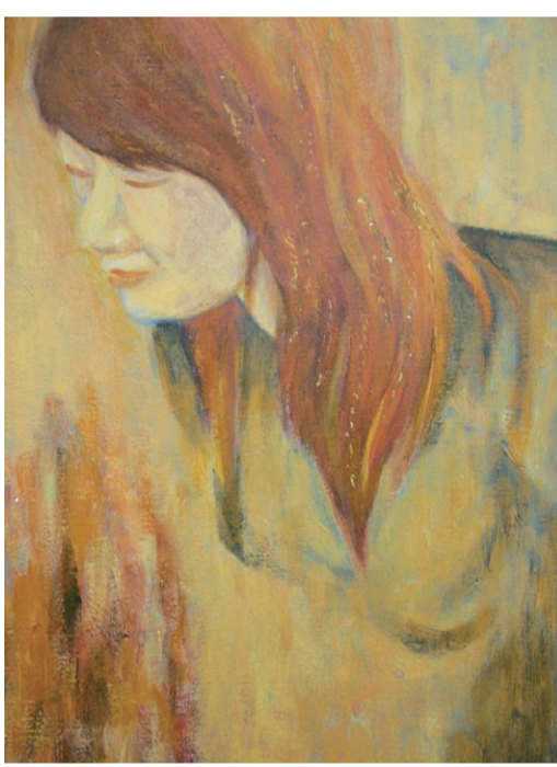
油彩・木製パネル