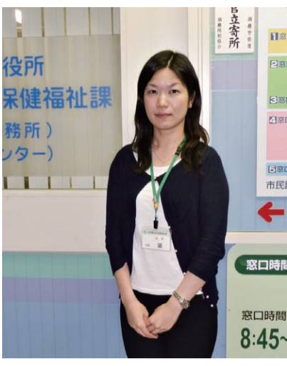
役所保健福祉課(事務所)カウンター

「直接住民の皆さんにお会いして、地域健康づくりの活動のリーダー養成とか、病気の予防や健康づくりのお話をすることもありますが、前よりは減りましたね。今 「ふれあいのまちづくり協議会」は、地域福祉センターを拠点に高齢者、障害者、子どもなど地域のすべての人々が、温かい触れ合いの中で暮らせる街づくりを目指している。この協議会には、自治会、民生委員・児童委員協議会、婦人会、老人クラブ、子ども会などが参加し、おおむね小