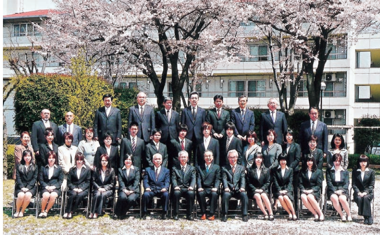
保護者職員と共に記念撮影

第33回となった平成22年度心塾東京学生寮の入塾式が4月11日、イベントホールで行われた。大