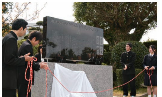
中種子高校62年の歴史を記した 「閉校記念碑」の除幕式(3月1日)

その中央部にある鹿児島 立中種子高校が3月2日、 62年の歴史を閉じるにあ り、残った生徒会費の全額 約9万円を本会に寄付して くれたのである。