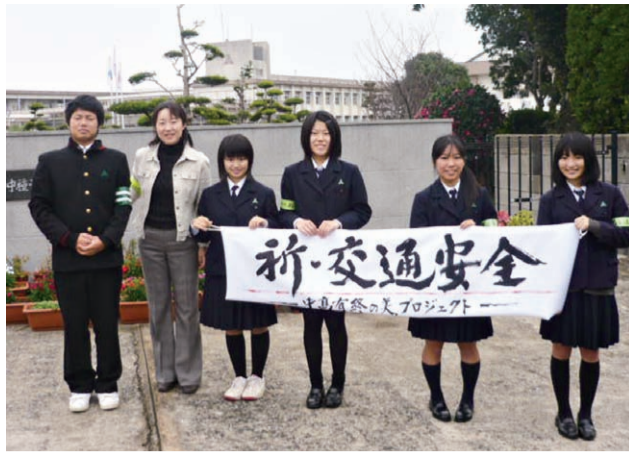
「中高有終の美プロジェクト」第1弾として 行われた「交通安全呼びかけ運動」

島の県立高校2校は、少 子化に伴う統合の波を免れ なかった。2年前、中種子 高校と隣町の南種子高校は 生徒募集停止となる一方 で、種子島中央高校が開校 し、今年全学年がそろった のである。