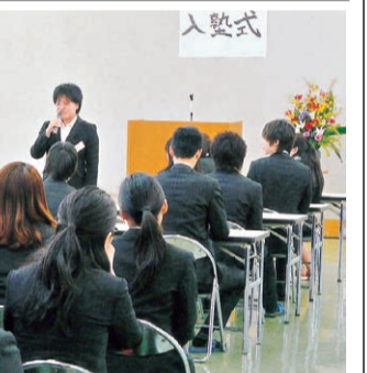
堂々と決意表明をする新入塾生

と母親として、人生の先輩としての気持を述べた。散り惜しむ桜をバックに前庭で記念撮影をしたあと、中庭に移動し恒例の記念植樹。ふたり一組となり、鮮やかに咲いている仙台しだれ桜に土を掛けていた。