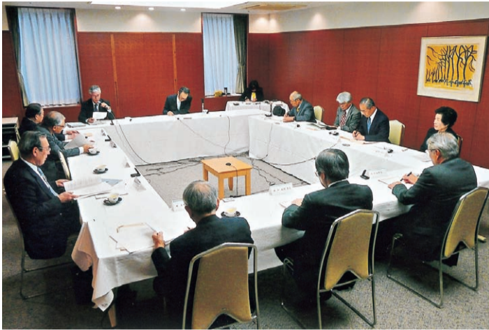
22年度の事業計画と収支予算を決めた第82回理事会

財団法人交通遺児育英会は3月29日、東京都千代田区平河町の海運ビル会議室で、平成21年度第7回臨時理事会、第82回評議員会と理事会を開き、平成22年度事業計画と収支予算を決定した。 ●22年度事業計画 22年度は、4年目に入った第2次長期事業計画の推進、特に公益財団法人への移行を年度内に申請することが最大の課題である。また、資金運用環境の悪化や寄付の縮小が懸念される