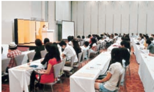
好評だったお母さんの講演(今年の「つどい」から)

交通遺児育英会の平成23年度「高校奨学生と保護者のつどい」実施計画が内定した。「つどい」は、奨学生同士、保護者同士、さらにまた奨学生の家庭と本会の親睦を図ることを目的として、全国を3ブロックに分け、高国が在学中に参加できるように毎年順番に開催しているものである。