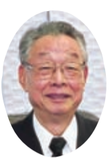
卒業生の皆さんへ

あなたが両親から受けた資質はこの世に二つない宝です。あなたの資質が100%発揮されれば、今まで世になかったものが創造されることが期待でき、それはすなわちあなたができる世界への貢献であるわけですから、あなたの資質が100%発揮できるように