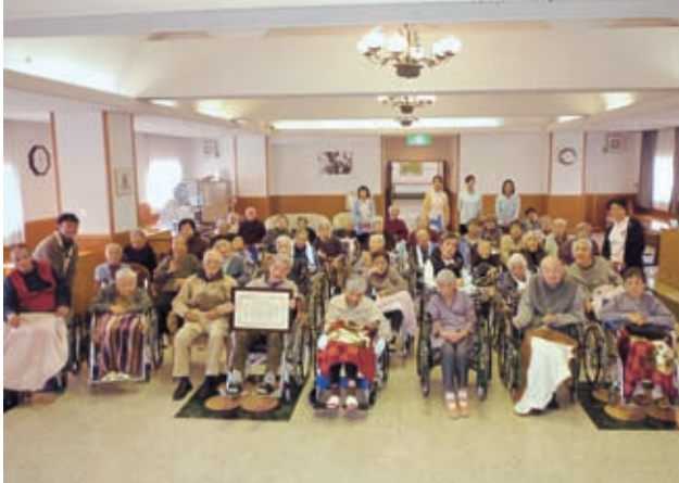
本会からの感謝状を喜んでくれた入居者、介護する職員の方々

昨年11月、兵庫県中部の「ホーム」みぎわ園 自治会 西脇市にある特別養護老人ホームから例年通りの寄付があつたが、その際次の一文が添えられていた。