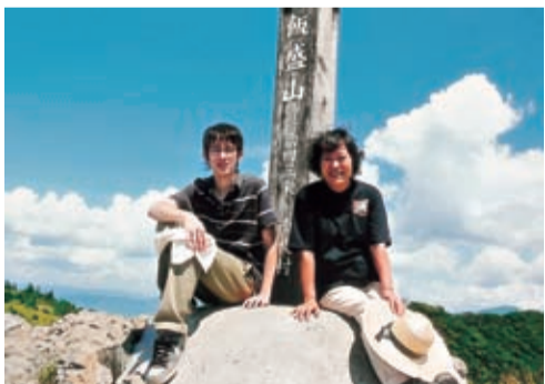
親子で飯盛山(長野県南牧村)に登山(昨年8月)