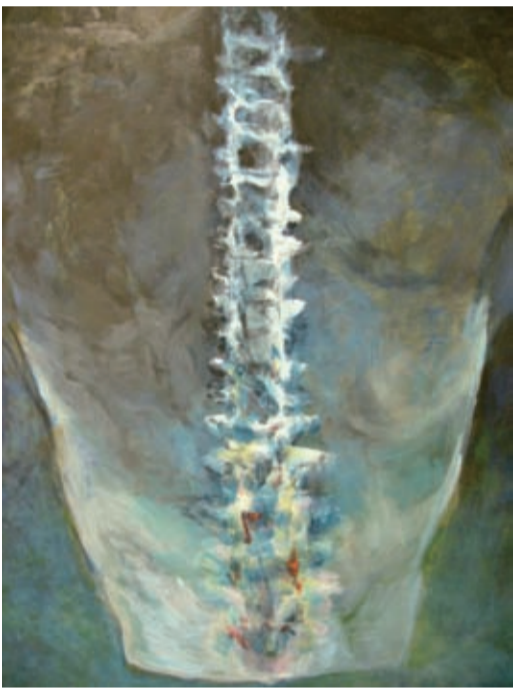
油彩・木製パネル