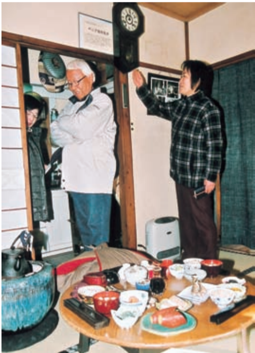
昭和を知っている来館者だと話題も広がる

この学芸員をやってみなしかと勧められた。この年齢で初めての仕事が経験できるといっても興味深く、また毎月決まった収入がある暮らしはやはり安心——