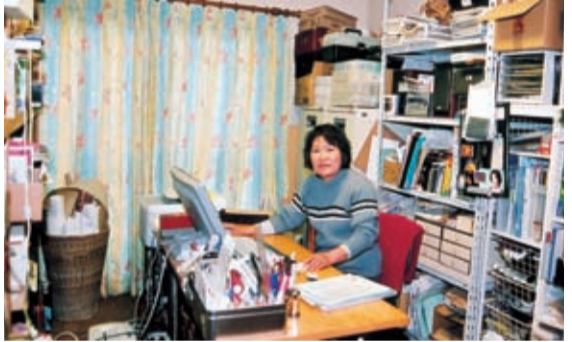
出版の仕事部屋は資料などがいっぱい

にあふれるような愛情を注いだ。保育園には毎日、肩車をして連れて行く。近所でも評判の良きパパぶりだった。