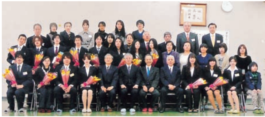
保護者、職員と一緒に記念撮影