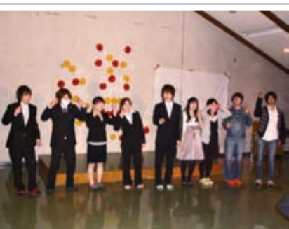
表情も晴れやかな新成人たち

心塾東京寮の平成22年度成人式が1月15日に行われ、男女11人が大人の仲間入りをした。