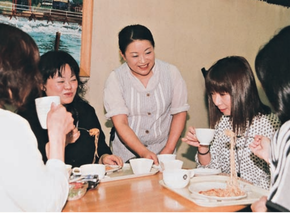
忙しい中でも女性職員の皆さんとかわす会話はとても楽しい