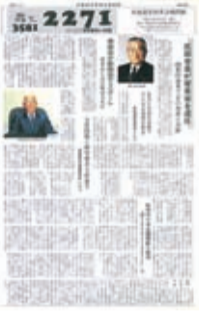
復刊第1号(平成6年10月15日発行)