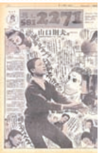
創刊号(昭和47年3月25日発行)