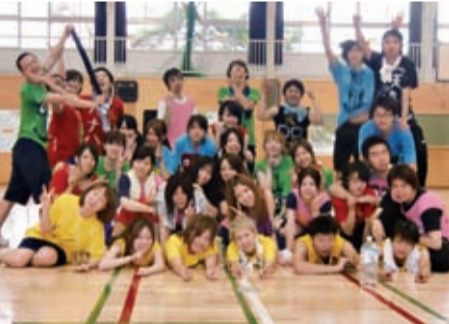
スポーツフェスに集った塾生

大震災被災者には猶予制度。被災された方は、この返還猶予をフル活用されることを期待しています。生活基盤の早期回復に少しでもお役に立てること、返還が計画どおりに行われていないと滞納通知を発送し、返還の督促を行います。滞納は後輩奨学生業時に提出していただく必要があります。卒業後、後輩を「完了通知」をお送りします。