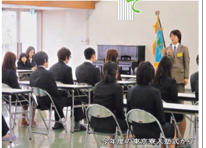
今年度の東京寮入塾式から