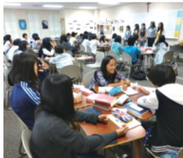
昨年のアメリカ研修風景

▼応募資格 現在、高校1、2年、中学3年（1996年4月1日以降生まれ）に在学し、心身ともに研修に適應でき、英語習得、異文化交流に意欲のある高奨生（派遣時）。 ▼選考 3月上旬に作文審査で1次合格者を選抜、同月末に東京、大阪で面接を行い、研修生を決定する。 ▼研修費用 国内運賃を含めて、費用は育英会が負担する。