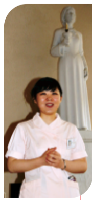
中世欧州の修道院をしのばせる異国情緒あふれるキャンパスで

「聞いたら泣きそうだし、何も覚えていないのに聞くのはどうかな、と、思ってしまった」