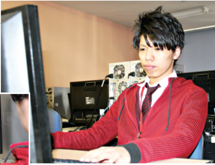
絵心を生かしてゲームのキャラクターも制作