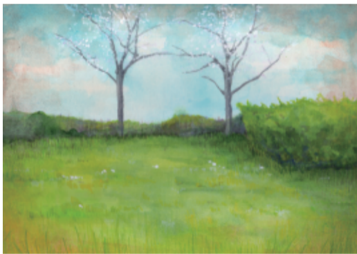
アクリル・ボード