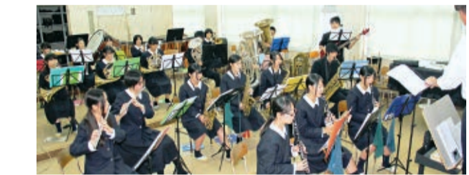
大学に進んだら趣味としてジャズにも挑みたいと、週末も休みなしの練習が続く

定期演奏会向けに楽譜が10曲くらい配られていて、それに集中しています」と、音楽漬けを楽しんでいる。彩さんには、お父さん、お母さんがいて、ママがいる。「物心がついたころから、祖父母をお父さん、お母さんと呼び、母をママと呼んでいます」