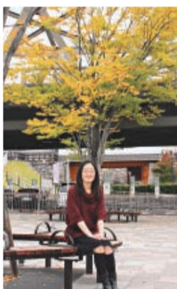
▲冬間近を思わせるJR甲府駅前