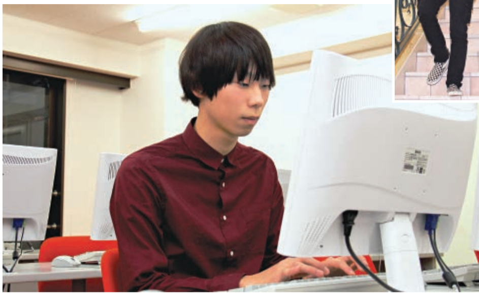
間もなく卒業。社会人になる前にたくさんのアルバイトも経験したいと思う