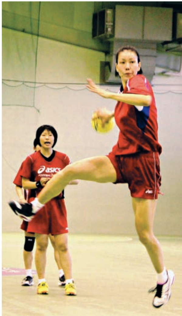
冬はリーグ戦の真っ最中。格闘技と駆け引き、の練習に明け暮れる