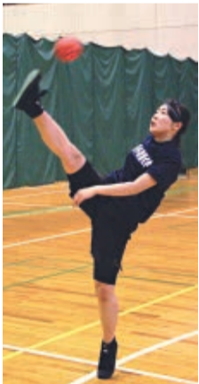
▲思いっきりサーブ