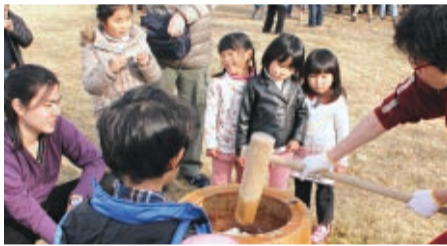
（上）大鍋の豚汁の湯 気が寒波を押し返す （下）興味津々で臼を 取り囲む子どもたち