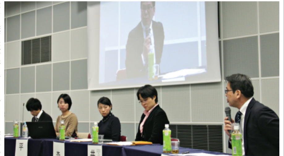
遺児・家族の体験を語り合うシンポジウム(大阪)