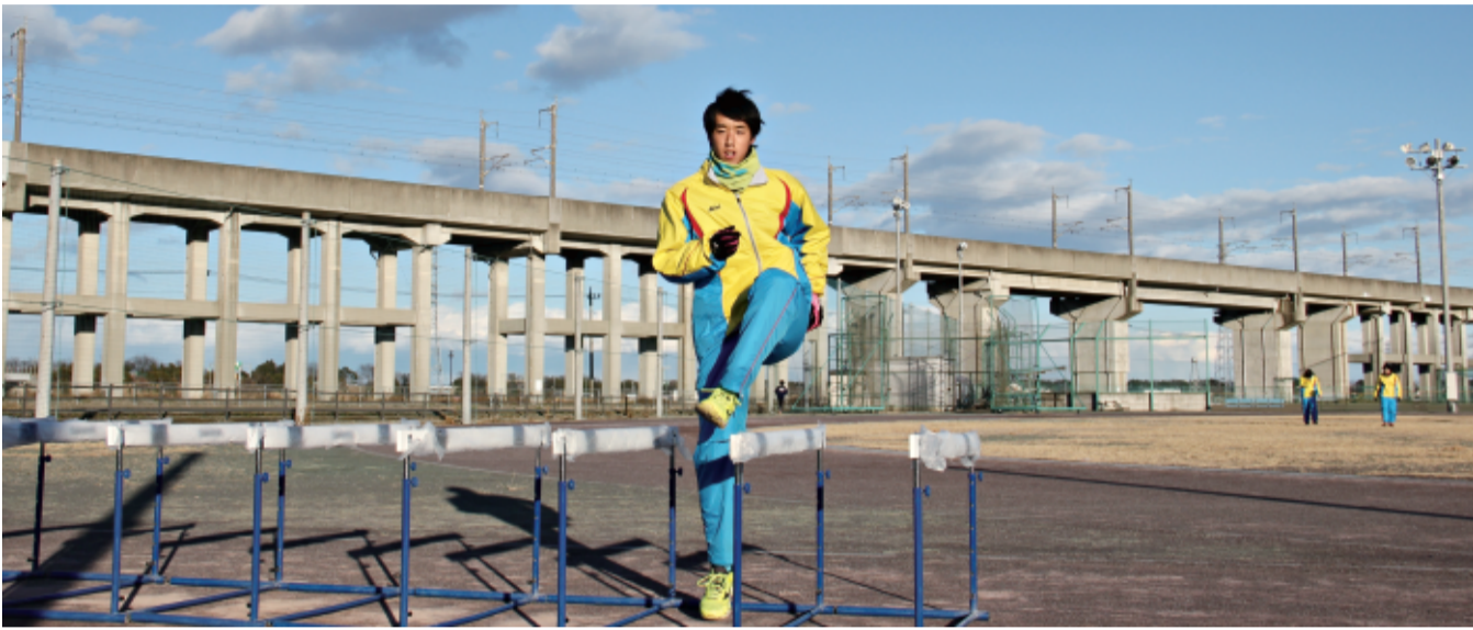
広大な校庭の一角で基礎練習を反復、「あと20センチ」を目指す

練習も楽しい」はさみ跳びで始めたが、他校の生徒も集まる練習会で、さすら跳べない。半年近くして成功。「うれしい、の一言だった」と、すぐ大会に出て1.75をクリアした。