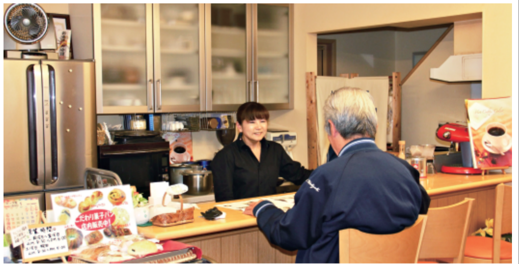
年配の常連さんが多い店内では、おしゃべりも大切なメニュー

「野菜を中心に手作りの店と考えて、里は人が集まる場所だから、菜里」と名づけました。お客さんは「読めない」というけど、