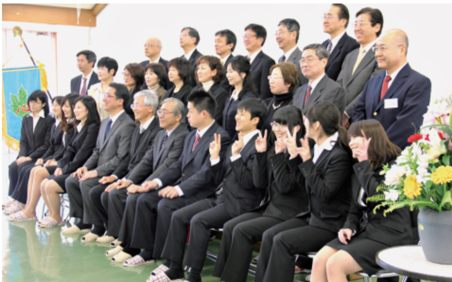
東京寮塾式で記念撮影