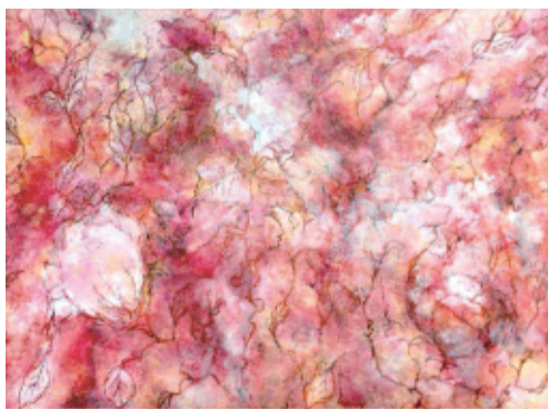
東京造形大学 2年 寺内 遥奈

また、かねてから進めている知名度向上の一環として、ACジャパンのキャンペーンへの採用が