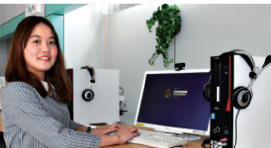
「勉強も仲間と遊ぶのも楽しい」と北の大地で学生生活を満喫

「舌で味わう食べ物の香り がフレーバー、口に含まず鼻 で楽しむのがフレグランスで