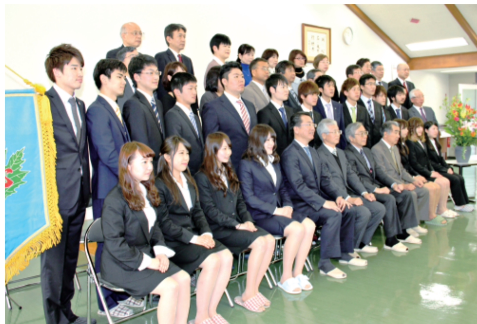
心塾で入塾式 (記事3面)

奨学金と異なり、返済学校に、下宿やアパートから通学する奨学生が対象。すでに相応の恩恵を受けているとの判断から、給付は見送られた。