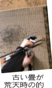
古い量のが荒天時の的