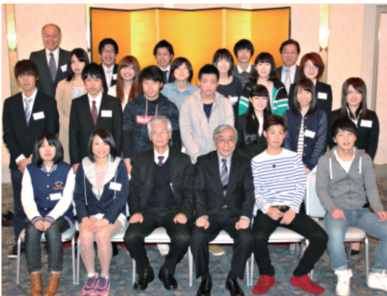
関西寮入塾式に出席した新入生(前列)の記念撮影(大阪で)