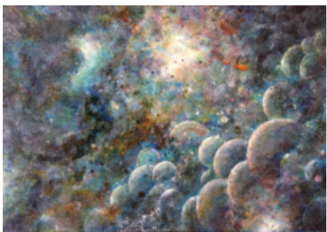
アクリル パネル 墨

救われるときはないであらう」 これらの意見はまさにいまの私たちに投げかけられていると思います。 山田風太郎の『戦中派不戦日記』(講談社文庫)では、骨の髄まで軍国主義教育を叩き込まれた当時23歳の医学生であった山田やその友人らが東条英機を賛美し、降伏は許せない、最後の一兵まで戦えは必ず勝つと気炎をあげています。 これを見ると、情報が秘匿され真実が知らされず、教育が偏向すれば歴史は愚行を繰り返すだろうと怖れを感じます。我々は、それを回避する知恵を学ばねばなりません。