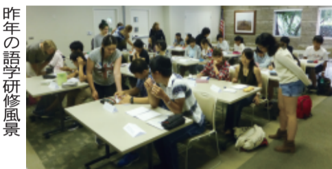
昨年の語学研修風景

交通遺児育英会は、28年度海外語学研修への参加を希望する高校奨学生を12日から募集する。研修先および定員はアメリカ30人、オーストラリア4人。「原則として英語検定3級以上の資格取得者」に限り、3月末までに研修生を決定する。