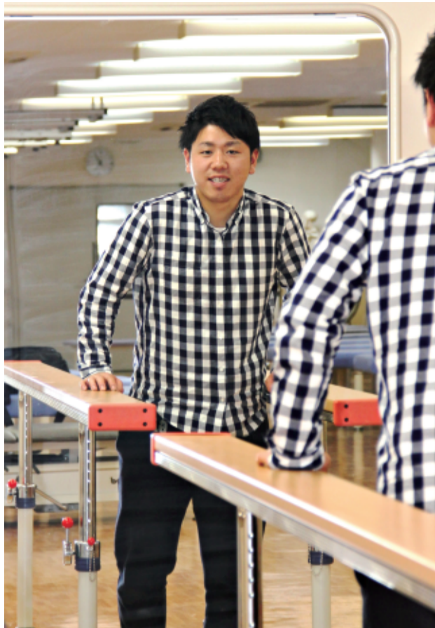
患者になり切って平行棒で歩行訓練▲