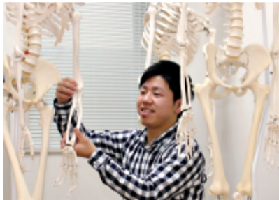
中核とか呼吸器といった内科的な科目は苦手です

— 理学療法士になろうと 考えたのはなぜですか？ 示 5から野球をしていたんですが、高1の冬にピッチングマシンの球が右手に当たり、小指のつけ根を骨折しました。投手だったので1か月も投げられず落ち込んでいたとき、そのリハビリで理学療法士から勇気が出る言葉かけられました。理学療法士になった野球部OBが試合のときなどに来てくれて、けがやストレッチの話も聞いていたこともあって、自分もやってみようと思えました。— — どの勉強をするんですか？ 「体を動かすことだけを学ぶのかと思ういたら、心理学とか教育学とか精神や心理に関する勉強もあって、『無理だろうな』と嫌になったこともあります。外科的な整形の科目には興味ありませんが、