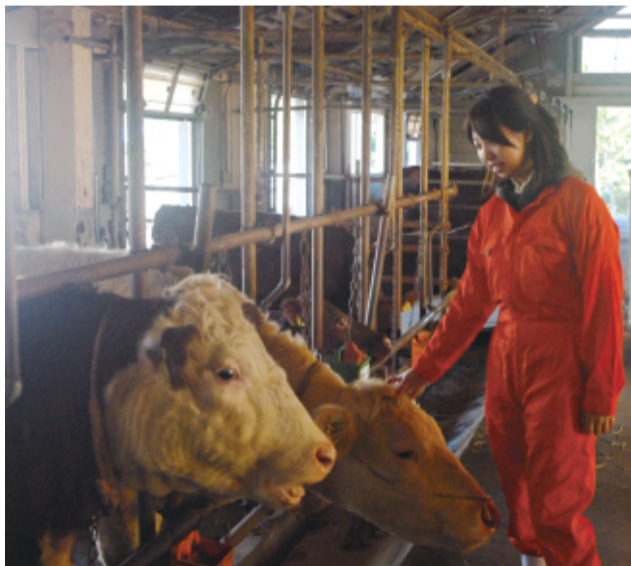
牛舎で搾乳の実習も

「いま、愛玩動物の獣医は飽和状態で産業界分野が不足しているから、先生はそちらを勧めますが、求められるところに行くのがいいのかなど。やはり、母に万が一のことがあったら、弟が小さいので、自分がしっかりしないと、養ってあげられないから」