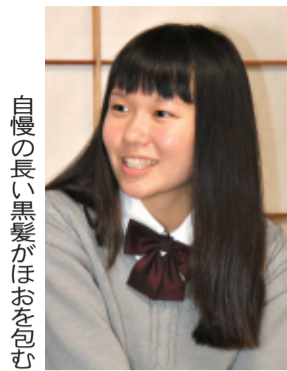
自慢の長い黒髪がほおを包む

昨夏、県文化祭の茶会で、(亭主の茶事を補助する)半東を務めた。茶の湯仕込みの「お・も・て・な・し」の入り口に立った。