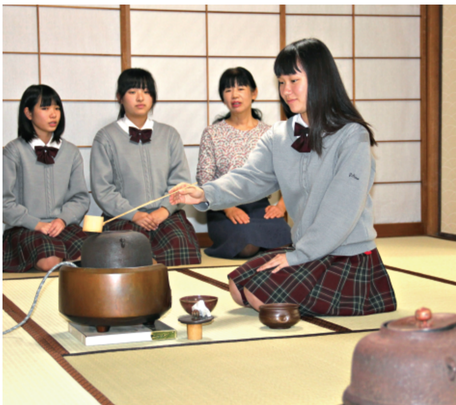
「稽古が週1回しかないの、細かい作法を忘れてしまう」が、手順を思い出しながら仲間に茶をたてる