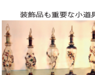
装飾品も重要な小道具