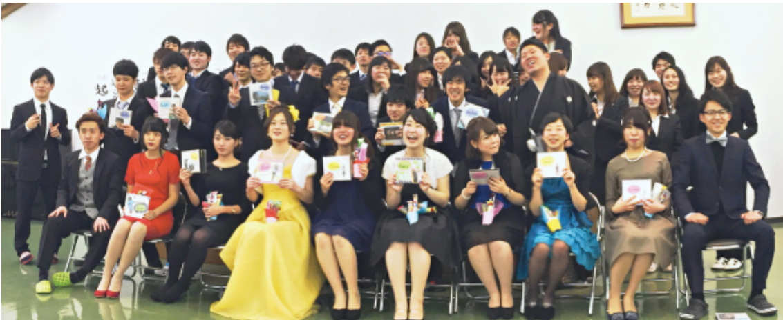
在塾生に囲まれ喜びの新成人塾生(前2列)