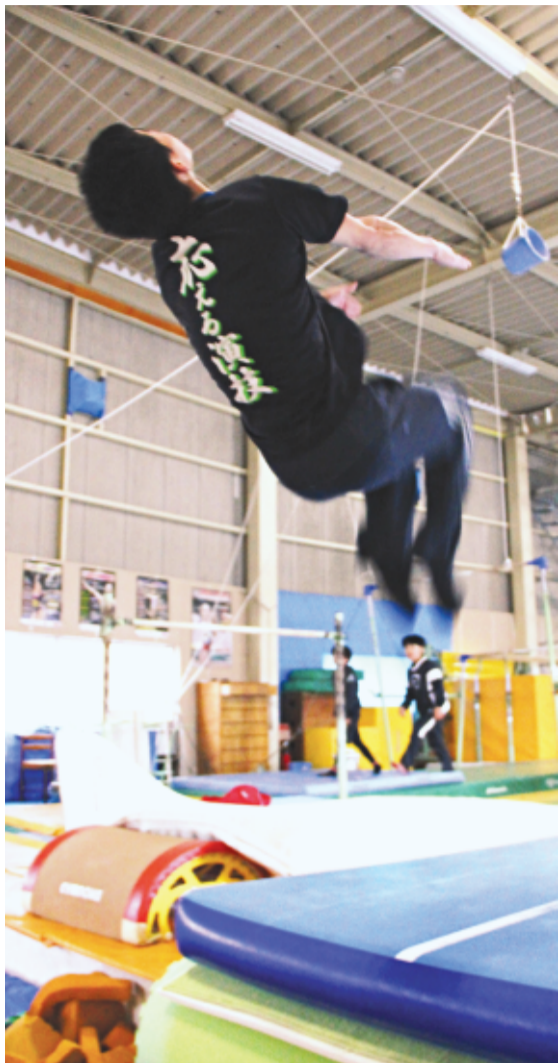
3年前、初めてバク転に成功したヤクルト甲府体操クラブ練習場で、後輩やジュニア選手にアドバイスする傍ら自らもひらりと後方2回宙返り

「父に、「警察官になれ」とよく言われた。当り前のように、昨秋の警察官試験に挑む。合格に届かなかった。気落ちする間もなく、「専門学校で警察官コースに進んで、次の準備をする」と決めた。4月から、「サッカーも新体操もいったん休みに