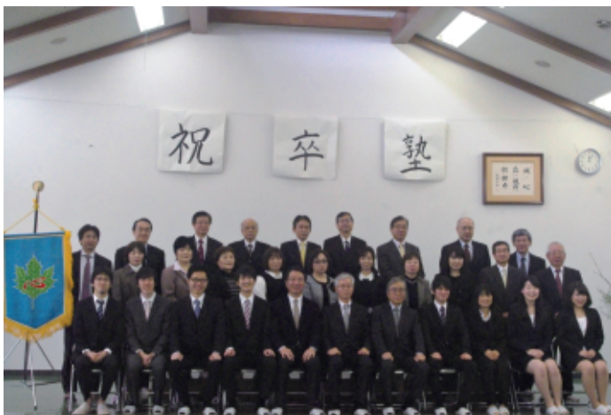
職員と一緒に記念撮影