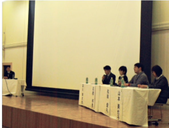
福岡県中小企業振興センター(福岡市)で

贈る言葉」でお話しし たので、今日は書くこと について考えてみたいと 思います。 例えばいま、1千字の 卒をあげるからあなたが 考えていることを書いて みてくれませんか、と言 われたらどうでしょうか。 それは結構なチャンス をあげがとう、とすぐ書 ける人はそうでもない でしょう。普通そんなふ うにいつも書きたい対象 を整理しながら生きてい る人は、少ないと思うの です。 書いてみてくださ い、と言われているのを見ても 分かります。 しっかりと裏付けが 取れて初めて、あなた ある視点に立った問題提 起ができることになりま す。その問題提起で終わ っては、おもしろくない というか、ただ文句を言 っているだけで無責任で すから、話の流れから言 えれば当然解決策の提示が 待たれるわけです。 では、その策はと考 えらるべきに相当の勉強が 必要で、また幾多の文献 をあさることになります。 その勉強から幸いにもい くつかの策をひねり出す ことができたとして、そ れで終わるわけにもいき ません。それらの策を比 較検討して、この策で なければならぬと思っ たと提起できたとき、あ なたの書き物が世に一つ の価値をもたらします。 これが世界を一步前進 させる新たな価値である 可能性もあるのですから 楽しいではないですか。 皆さんもチャレンジして みませんか。