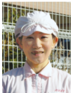
昼食の準備をする