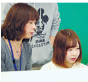
音楽の授業では、課題曲のピアノの連弾もある

「学校では委員会活動に積極的に参加していますね。『オープンキャンパスのスタッフリーダーをやっています。キャンパス案内のパンフレットを製作したり、プログラムに折り紙制作の実演やスポーツイベントを組んだり、保護者対応もします。昨年は『どもコンサート』の実行副委員長も。7月に2日間、近隣の子どもを呼んで行うんです。卒業後の進路はどうですか。」