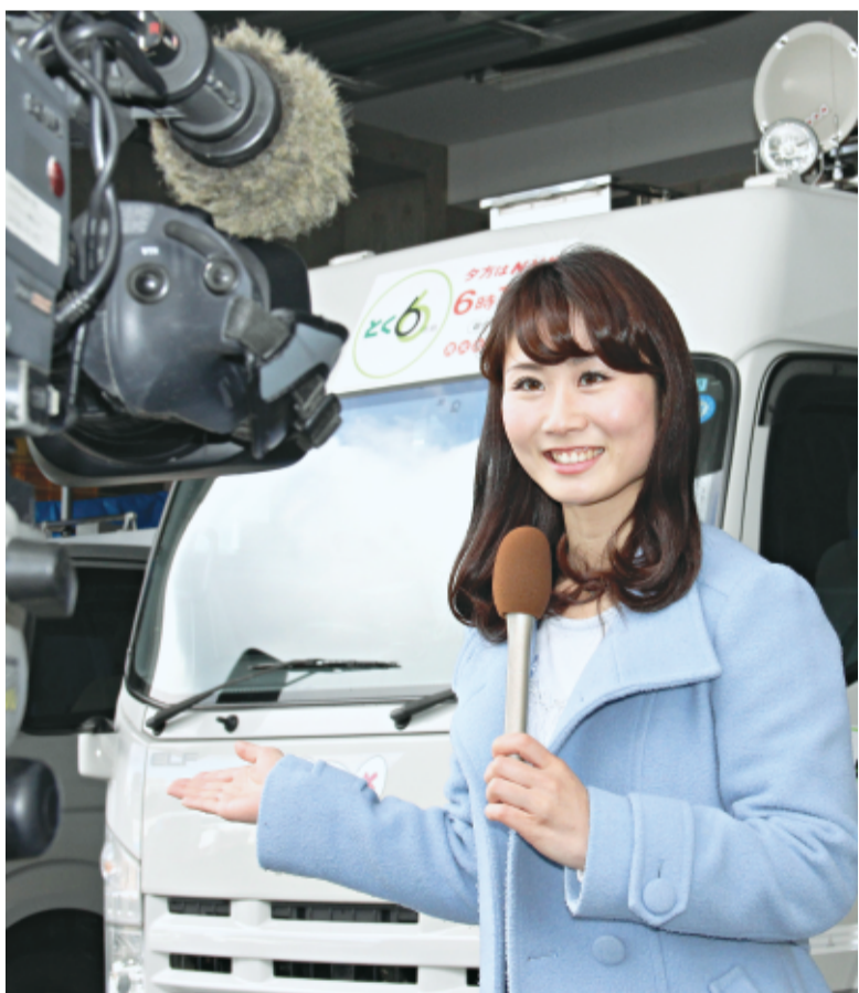
幼いころは話すのが苦手だったが、いまはカメラに向かえば思いを伝えるリポーター顔に