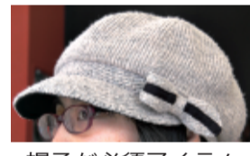
帽子が必須アイテム