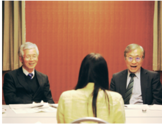
3月下旬に東京で行われた面接審査

今年度の海外語学研修生を決める書類・面接審査が3月に行われ、アメリカコース32人、オーストラリアコース2人の計34人が選ばれた。このうち約半数を占める1年生は、ほとんどが中学生時に参加要件の「英検3級相当以上」の資格を取得するなど、強い参加意欲がうかがえた。 半数は1年生、中学で資格取得