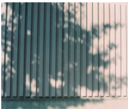
カメラ：Rolleiflex フィルム：Kodak PORTRA400