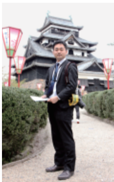
昨年5月の松江城(後方) 国宝指定の審議会答申では、得意の歴史分野で1面を飾った