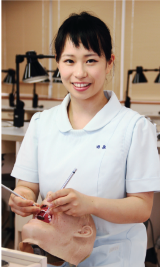
練習用人形「ファントム」(写真左)の歯に真っ赤なマニキュアを塗ってスクレーン

除菌剤を使って拭いたりするようになります」 「では、毎日、どれくらい歯磨きしていますか?」 「日に3度、10分くらいずつ。鏡を見ながら、歯の面を考えると丁寧に15分、30分といふこともありますよ。笑うと『きれいな歯だね』と友だちや家族に言われて、自分の歯が好きになりました」