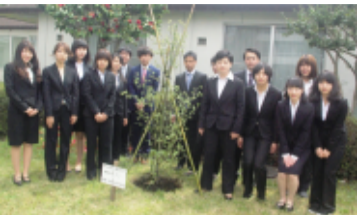
心塾東京寮で新塾生の植樹式

東京寮に19人 交通遺児育英会の心塾入塾式が4月、東京、大阪でそれぞれ行われ、合わせて32人が寮生活をスタートさせた。