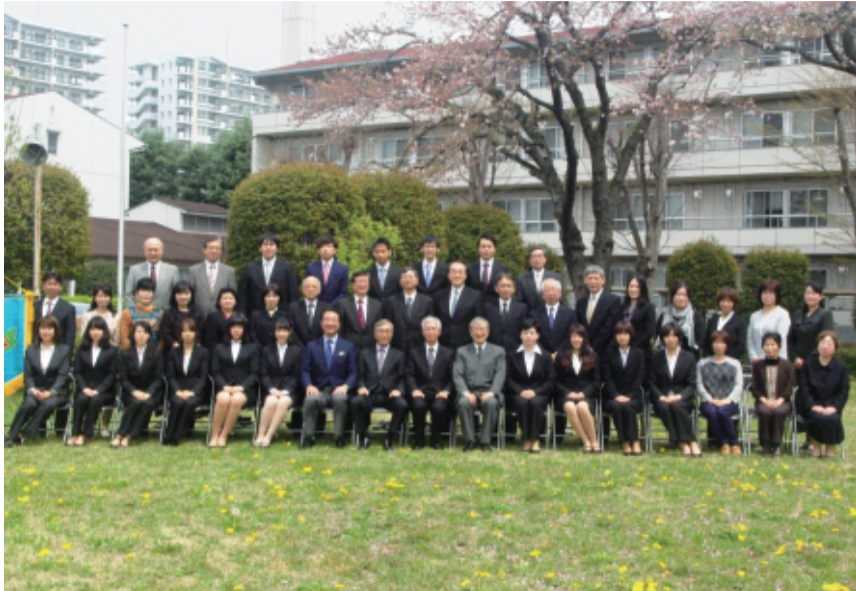
心塾で入塾式 (写真は東京寮 記事2面)