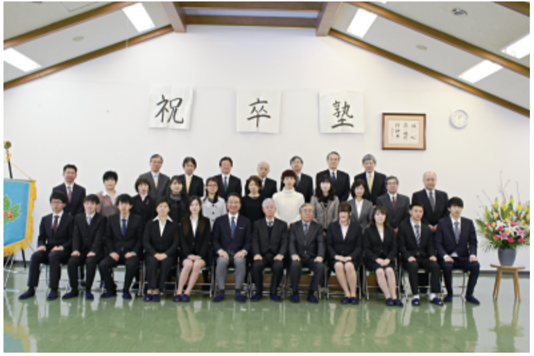
職員と一緒に記念撮影する東京寮卒塾生

イラ立ちが募る毎日でしたが、3か月後に神奈川県警の内定をもらおうと、すべての祝福から解かれ寮仲間との交流で、たくさん思い出ができました。ここで得た友人はこの先もずっと大切にしたいと思っています。