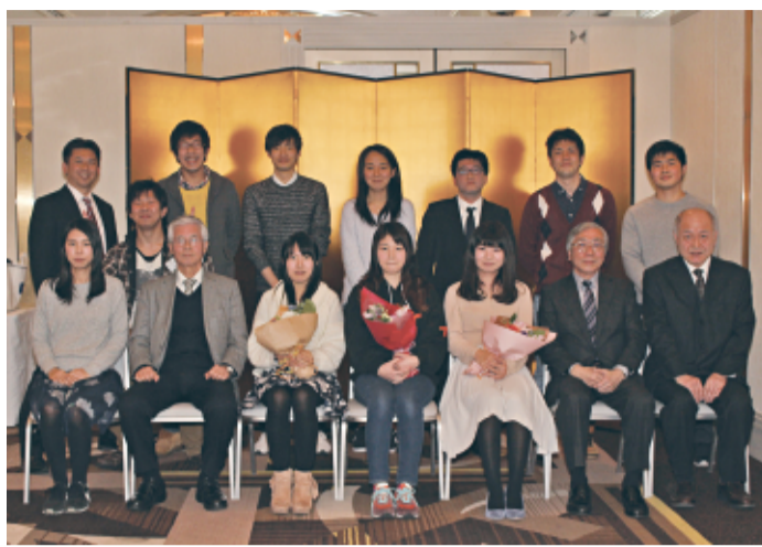
心塾関西校の卒塾生を囲み、関西校OB、現役塾生、職員