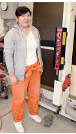
工房はいつでも利用できる

手に作って、同級生に「うまいねえ」とほめられた。高校では美術の方面に進みたいと思い、大学入試は実技でデザインの科目があるので、画塾に通った。そこで塾と高校の進路指導の先生から、プロジェクトデザインという分野