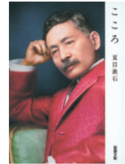
今年大学院を卒業する。6年間私の夢のため学費を出してくれた母には感謝している。卒業後、司法試験を受験し法曹の道へ進む予定である。これまで支援してくれた皆さまへの感謝を忘れず、少しでも世の中のためになればと考えている。

心塾は私の安心できる居場所でした。集団生活を通して思いやりの心や協力することの大切さを学びました。春からは私の夢だった美容部員として働きます。