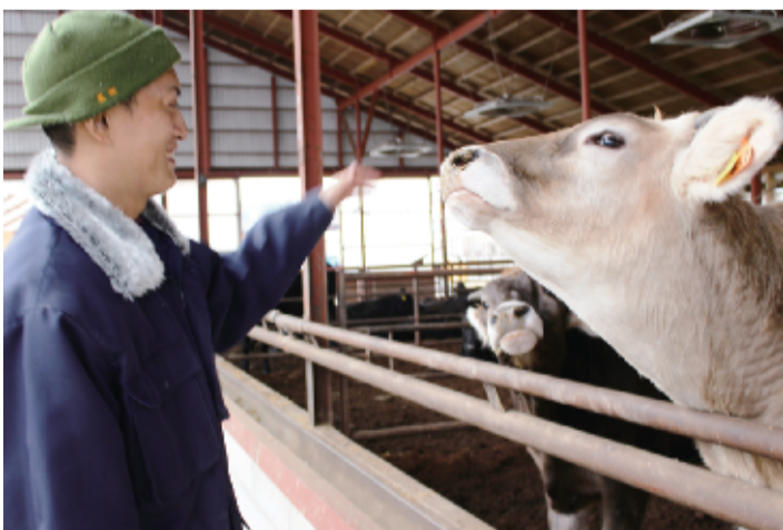
ブラウンスイス牛、下は子牛。牛舎にはホルスタイン牛も。全部で2200頭いる

「それらの経験がいま役に立っています。自分も34歳になり、ファームを継ぐ道かと思つて。ここがやっていて、自分たちが無事でいられるのは、17人の従業員とその家族のおかげです。