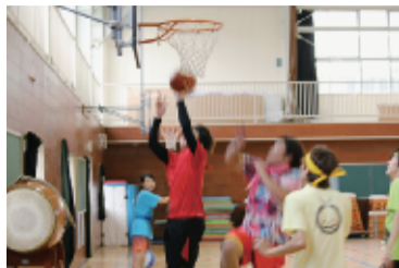
男子バスケットボール 「へびかわ」ゲーム