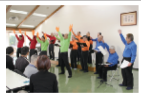
日野市の男声合唱団「エルデ」も参加