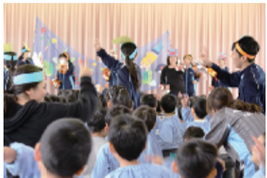
高砂市立阿弥陀保育園でリトミック保育実習。腹ペコあおむしなど