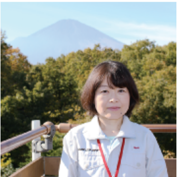
敷地の展望台から富士が望める