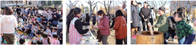
ビンゴゲーム 餅は磯辺焼きときな粉 餅つきを実体験