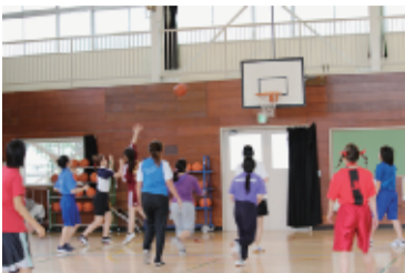
女子バスケットボール 全員集合

心塾東京寮では昨秋、スポーツフェスティバルを開催し、約40人が参加した。午前中は日野市立旭が丘小学校体育館で球技大会。バレーボールとドッジボール、バスケットボールをチーム対抗で競った。午後は東京寮の前庭で「へびかわ」や「ハリケーン」などのアトラクションゲームを行った。