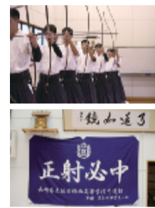
正しい射形は心技一体で。神棚の下には卒業生から贈られた「正射必中」の垂れ幕が(写真右)

「授業は生物に興味があります。社会も得意科目だけど、国語と数学は、すぐに頭に入ってこないですね。でも、分からないことがあれば、職員室に行って先生に聞けば、丁寧に教えてくれます。