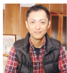
各種缶詰は各賞を受賞するコンビーフ缶詰

一昨年から水色ラベルの自社デザインにした。ユーチユーブやHPで発信し、食専門誌や新聞で紹介され、地元FMラジオにも毎週5分のコーナーを持つなど、PRに力を入れた。