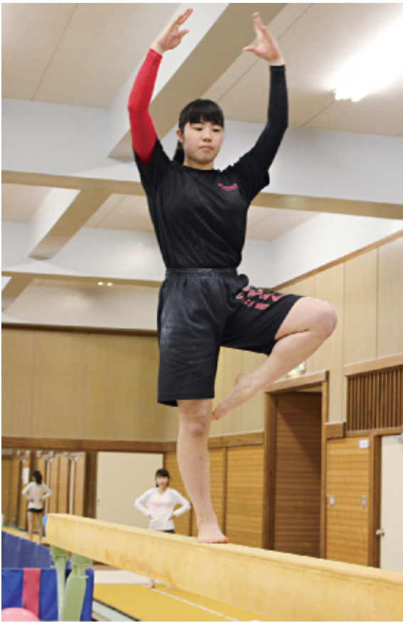
平均台に段違い平行棒、ゆかと繰り返し練習

みも返上で、毎日、朝8時から12時までの猛練習が続いた。新学期に入ると、新たに1年生も加わって放課後の練習が夕方6時過ぎまで続く。「ふつう運動部の3年は県予選が終わる5、6月で引退なんです。そこから皆、本格的に受験の準備に入ります。私も看護の資格を取ろうと4年制の大学を志望しています