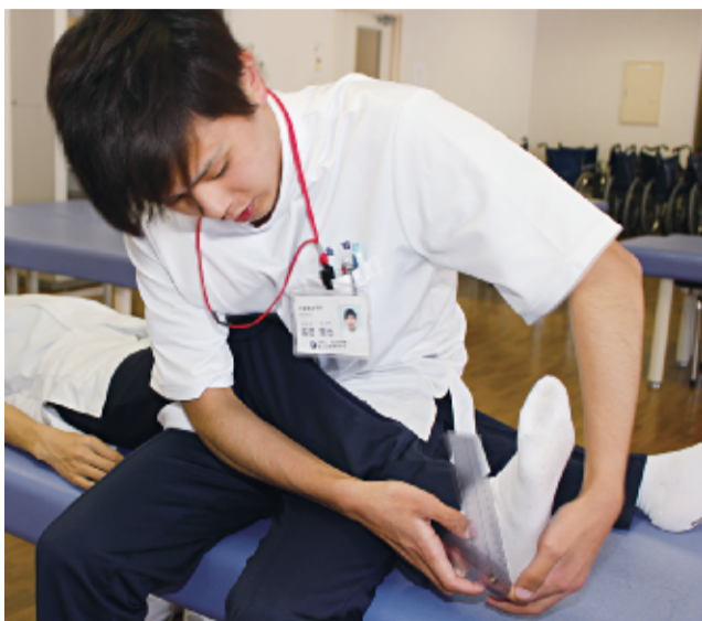
関節の可動域などを測定する

「授業は朝9時から夕方4時10分まで、1コマ90分の授業が昼休みをはさんで隙間なくあります。先生との距離も近く、何でも分からないこと