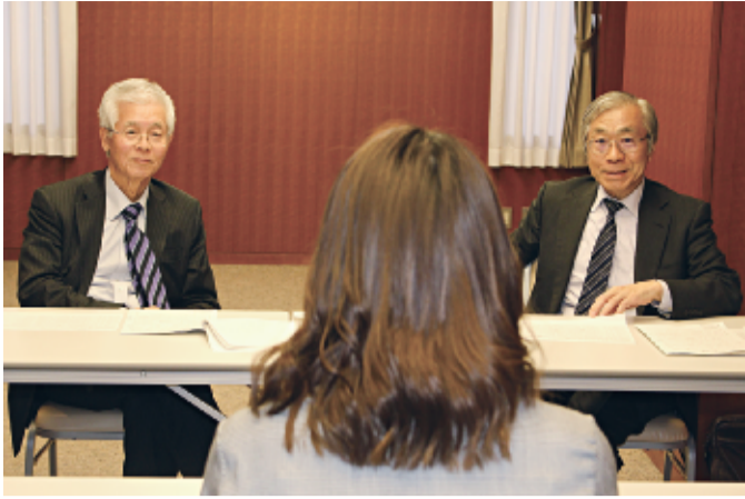
3月下旬に東京で行われた面接審査