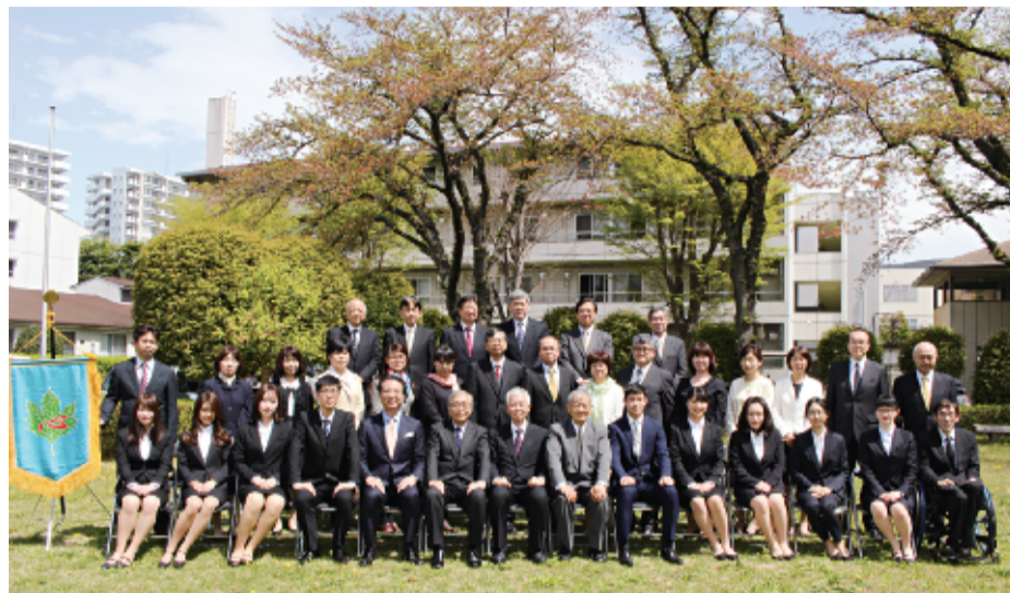
心塾東京寮の入塾式