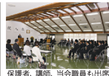
保護者、講師、当会職員も出席