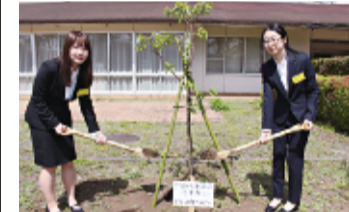
記念に河津桜を植樹した