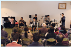
ジャズバンドの演奏に喝采

餅つき大会地域の親子ら250人参加 12月2日(日)、恒 例の餅つき大会が行わ れた。今回で40回目に なる。10時に開場し、 地域の親子ら250人 が参加した。