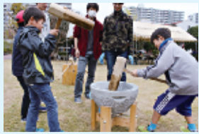
餅つきを体験する子ども