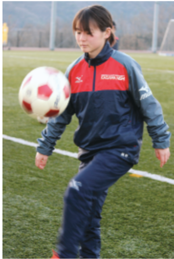
リフティングはお手のもの

まされ、今のところ、個人的には満足な結果を残せていません。とりあえず、スターティングメンバーに入ることが目標です。来年度は最後の年、優秀な新入生も入ってくるでしょうから、ぼやぼやしているのを避けられてしま