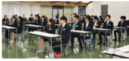
東京寮の卒業式には卒業生13人が出席

合いました。しかしそのたびに、絆が深まったと感じます。 本年度は塾生長という役を務めさせていただきました。塾生の模範となるのは私には少し荷が重かったのですが、何とか務め果たすことができました。この心算で過ごしながら多くの方々に支