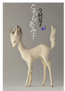
こちらあみ子 (ちくま文庫 691円)