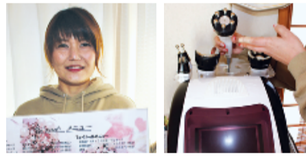
「気分転換は月1回のゴルフですね」