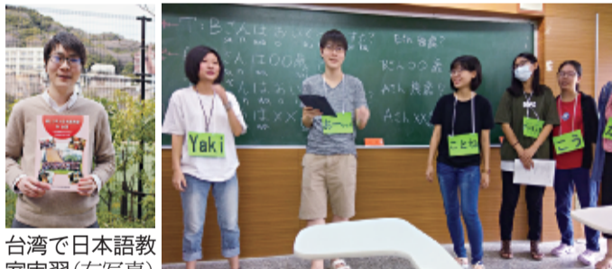
台湾で日本語教室実習(右写真)

「先生はノータッチで、日本語のプログラムは、学生が主体的に工夫して作る、自主運営です。毎週木曜日の夕方6時から7時半まで、教室を大学から借りて行きます。受講者は、台湾や中国、韓国、インド、ベトナム、ペルー、コロンビアなどから来日し、