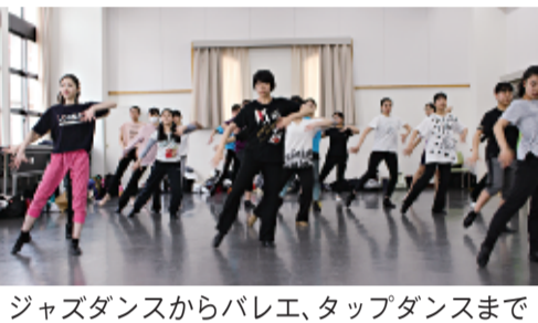
ジャズダンスからバレエ、タップダンスまで

活動は休眠状態だという。「歌って踊れるミュージカル俳優になるのが夢で、将来は芸能方面に進みたいと思っています。卒業後は系列の名古屋音楽大学に進学するつもりですが、大学に入ったら、