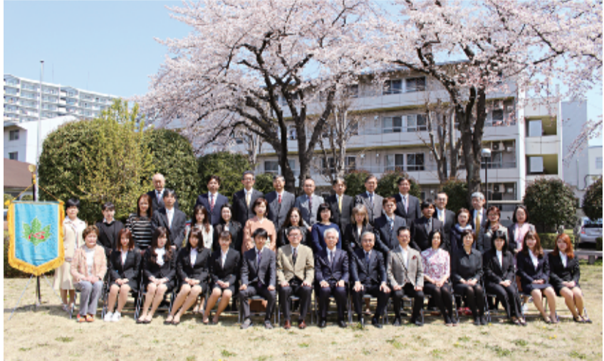
心塾東京寮の入塾式

4月、交通遺児育英会の心塾入塾式が東京と大阪で行われ、35人が寮生活スタートさせた。東京寮17人入塾