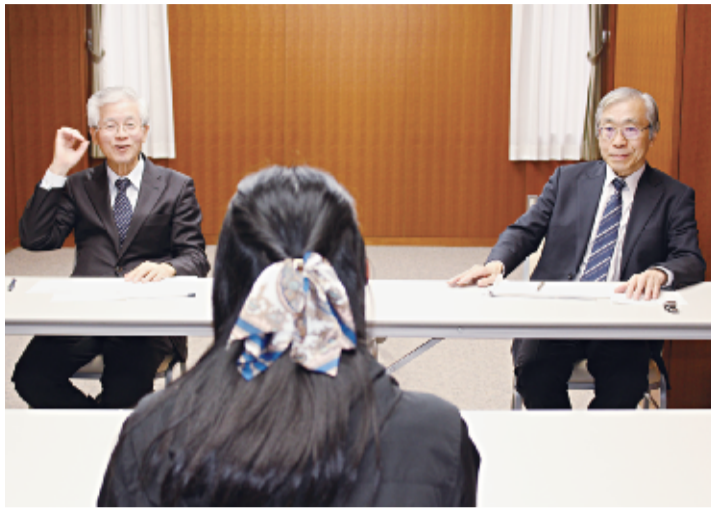
3月下旬に東京で行われた面接審査

平成31年度の海外語学研修生を決める面接審査が3月に行われ、アメリカ研修生25人(3年1人、2年15人、1年9人)が選ばれた。1年は3月にTOEICを受けた1人を除き、全員が中学で英検3級を取得していた。面接審査では、全員が