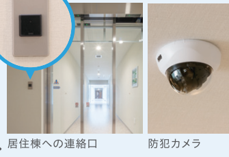
居住棟への連絡口

入館および共用棟と居住棟の往来には電子キーが必要です。防犯カメラによるセキュリティ対策も万全。また寮長、寮母も常駐しており、塾生の暮らしを見守ります。