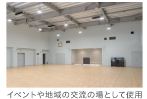
イベントや地域の交流の場として使用