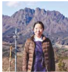
妙義山を背景にホテルで。下は下仁田・道の駅で