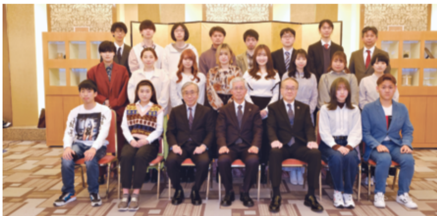
先輩塾生も駆け付けた東京寮入塾式①/関西寮では18人が仲間に加わる②