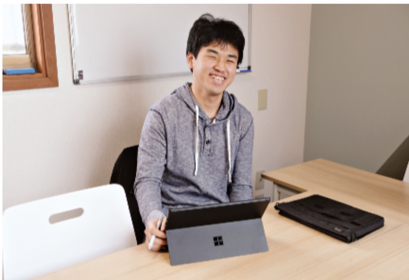
気分転換は地元局のFMラジオ。勉強のBGMにも「ちょうどいい」とか

「入学前は勉強中心の生活だろうと思っっていたのですが、勉強は医者になるための基礎、土台だと思うようになりました。学んで得たことの上にコミュニケーションがないと、エックしたり、医師との連絡調整も担当。患者さんへの話し方一つとっても声の大きさなど相手によって変えています。患者さんとコミュニケーションが取れないと十分看護は望めません。介助など看護助手のアルバイトから学ぶことは多いです」