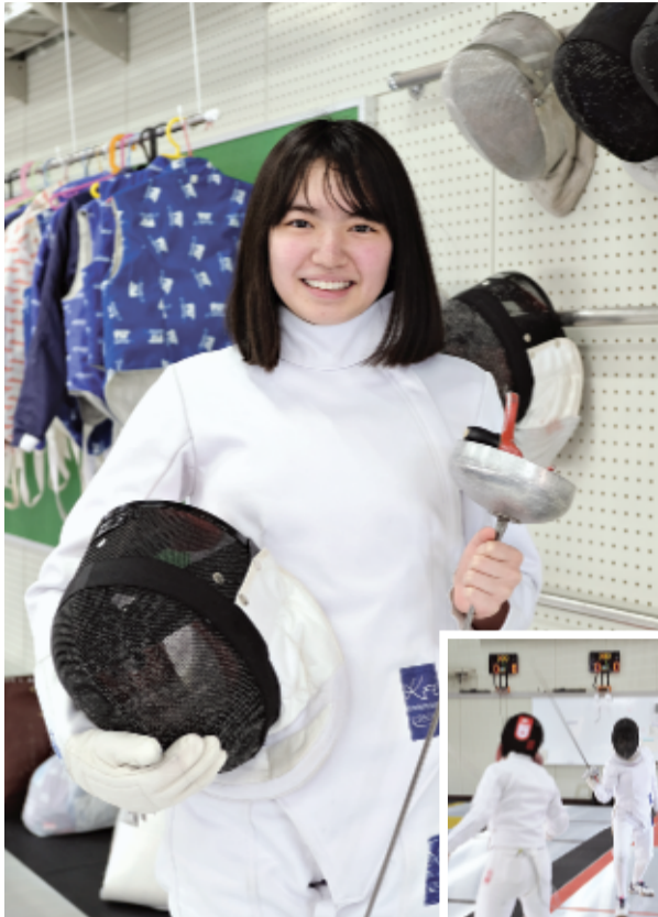
「試合で勝った時は最高にうれしい」。練習にも熱がこもる (右奥)