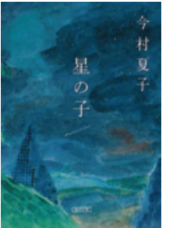
今村夏子 著 星の子 (朝日文庫 682円)

「水」に救われた。父の勤め先の同僚が薦める『金星のめぐみ』。朝な夕な、浸したタオルでちーちゃんを洗ってあげたら、2か月で「治った!」。 子の病に、手立てなく追い詰められた両親が、水を定期購入し、あやしげな宗教にすうつとのめり込んでいく様が淡々と描かれる。監禁され、酒や薬を飲まされ、ICチップを埋められ、水晶と花瓶を買わされた人がいる……2世仲間の会話には不穏なうわさも飛び交う。ちーちゃんも世間