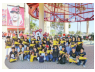
大リーグ・エンゼルスホームスタジアムで

コロナ禍で中断されていた高校奨学生を対象とした海外語学研修が4年ぶりに再開される。 3月には作文などの書類選考を通過した候補者の面接審査が東京、大阪であり、アメリカへ派遣される研修生20人が決まった。研修生は今夏、カリフォルニア州ロサンゼルス郊外の街・テメキュラで現地家庭にホームステイしながら約3週間を過ごす予定。