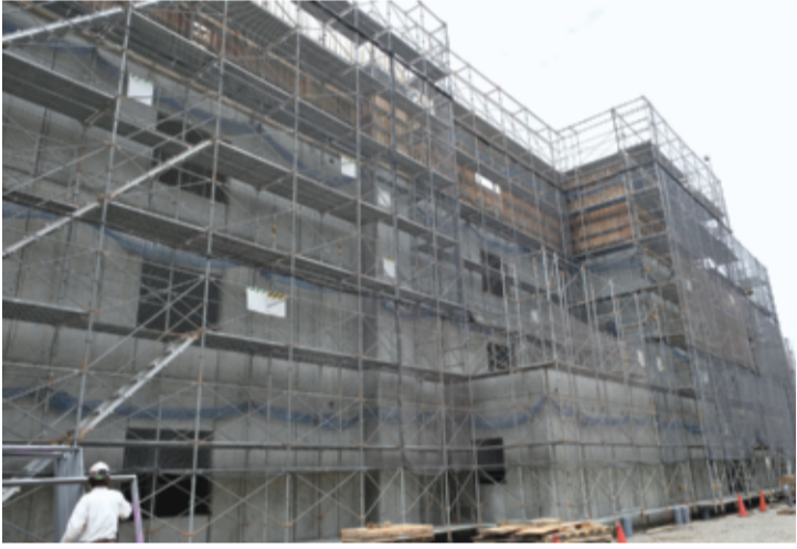
順調に進む居住棟(4階建て)の本体工事