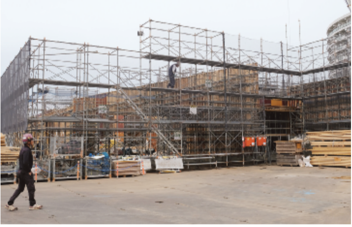
共用棟は旧心塾同様の傾斜屋根を継承

建て替え中の交通遺児育英会・心塾東京寮(東京都野市)で、学生らが生活する居住棟(男女別棟・定員68人)の本体工事が完成を間近に控えている。写真(いずれも4月6日撮影)。 居住棟には快適な住環境とプライバシー保護、高いセキュリティ性が保たれる内廊下設計を採用した。今後、各部屋の間仕切りを設置するなど順次、内外装工事が行われる予定。各部屋にはトイレ、シャワー、冷蔵庫、洗濯機、洗面台を完備。バリアフリータイプの居室に加え、大浴場、各階に多目的室(自習、実習用)、談話室、共用キッチンスペースも備える。 旧施設同様、傾斜した屋根が特徴的な共用棟でも本体工事が進んでいる。共用棟は全てバリアフリー仕様で、食堂、ラウンジ、イベントホール、研修室、ゲストルーム、スタッフルーム、塾長室などを置く。全館、耐震・防音・省エネルギーに対応している。