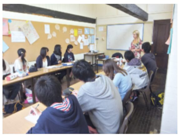
語学学校での授業風景①(退役したスペースシャトル・エンデバーを見学(カリフォルニア科学センター)②