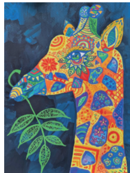
京都美術工芸大2年 西村 滯