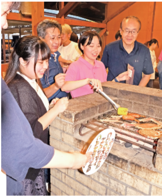
バーベキューを囲んで初秋の一日を満喫(神奈川県相模原市のPICAさがみ湖で、9月23日)

コロナ禍で中止されていた心塾の恒例行事が4年ぶりに再開され、塾生らはミュージカル観劇やキャンプを仲間たちと満喫した。観劇は劇団四季の「オペラ座の怪人」(関西)、「ライオンキング」(東京)を鑑賞。また、東京では神奈川・相模湖近くの施設で、バーベキューなどを楽しんだ。