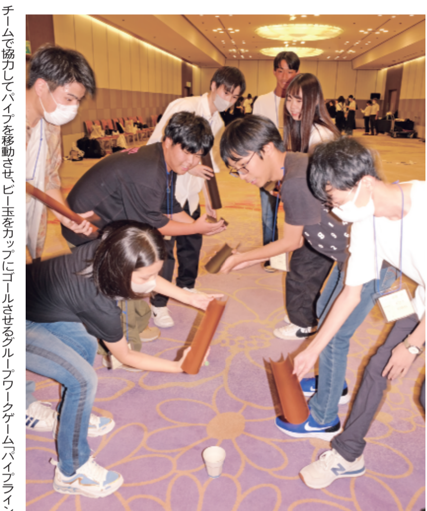
チームで協力してパイプを移動させ、ビー玉をカップにゴールさせるグループワークゲーム「パイプライン」

学生は、グループワークゲーム（GWG）会場へ移動。指導員を交えて計6グループに分かれ、オリジナルゲームで息の合ったコンベンションを披露した。ゲームはメンバの協力と工夫でゴールを目指すなど、仲間意識を高め、達成感を味わってもらおう趣向。初対面でも当初はきこなかった雰囲気も、ゲームをこなすにつれてグループ内に一体感が生まれていた。小学生以下の同伴家族は指導員が見守る中、キックプログラミングのゲームを楽しんだ。