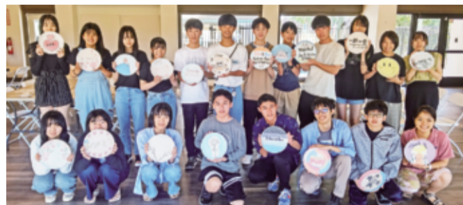
4年ぶりに再開された海外語学研修に参加した高校奨学生20人が8月12日、米国から帰国した。（写真は8月10日撮影。3面に研修レポートを掲載）